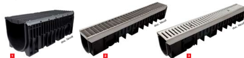
Vues détournées des nouveaux caniveaux Kenadrain® de Nicoll largeur 300 avec grilles fonte classe C250 [1] et les 2 caniveaux Kenadrain® (largeur 100 avec grille inox caillebotis B125 [2] et grille inox passerelle A15 [3]).

Soucieux de proposer des solutions aussi performantes qu'esthétiques , Nicoll développe également des grilles inox pour sa gamme Kenadrain® , avec des intégrations harmonieuses et réussies. Ainsi, le caniveau Kenadrain® en polypropylène largeur 100 est désormais livré muni de feuillures inox et d'une grille inox passerelle classe A15 ou d'une grille inox caillebotis classe B125 , montée et verrouillée.