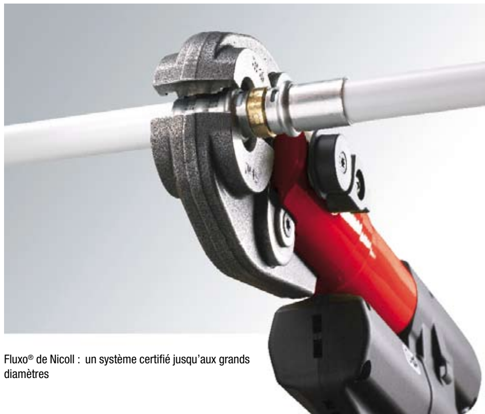
Fluxo® de Nicoll : un système certifié jusqu'aux grands diamètres

Pressenti pour devenir la nouvelle norme des installations chauffage et sanitaire, le système de tubes Multicouches Fluxo® avec raccords à sertir constitue la solution optimale pour toutes les applications de plomberie (distribution d'eau chaude et froide sanitaire, chauffage central, chauffage par le sol, climatisation). Sa grande polyvalence lui permet de résoudre toutes les problématiques rencontrées par les installateurs professionnels. Fluxo® convient en effet aux applications de logements mais aussi de bâtiments tertiaires (établissements scolaires, bureaux, commerces...), et d'industrie. Disposant de l'Avis technique 14/08-1252, le nouveau système Fluxo® de Nicoll s'installe idéalement en neuf comme en rénovation, offrant en prime la possibilité de mises en œuvre en encastré comme en apparent.