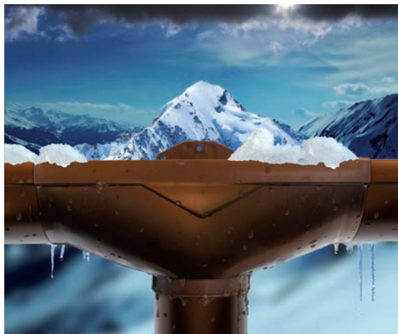
Pensée pour durer, la nouvelle gouttière Vodalis® de Nicoll est déclinable en 6 couleurs.

Disponible en sept langues, le site www.vodalis-nicoll.com réunit l'ensemble des informations relatives à ce système de gouttières, avec la possibilité de faire une demande d'étude personnalisée.