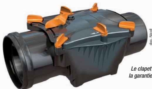
Le clapet anti-retour Nicoll : la garantie anti-refoulement des réseaux.

Avec le lancement du clapet anti-retour , Nicoll fait preuve une nouvelle fois de sa capacité à mettre l'innovation au service d'une démarche pertinente et durable sur le marché de l'assainissement.