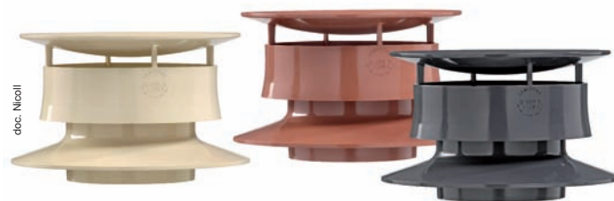
Zoom sur les nouveaux extracteurs statiques signés Nicoll.