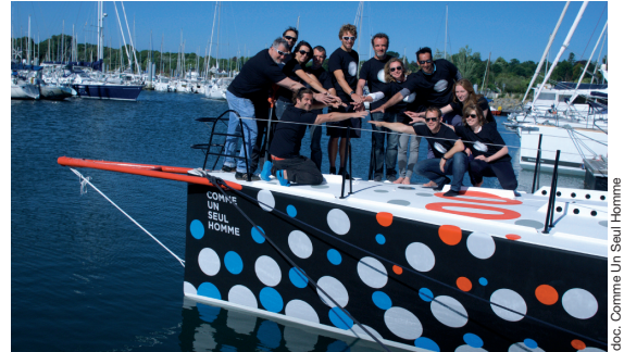
doc. Comme Un Seul Homme

Spécialiste dans l'injection et l'extrusion, Nicoll , leader européen des produits en matériaux de synthèse pour le bâtiment et les travaux publics, embarque aux côtés du navigateur Éric Bellion , dans son nouveau projet Comme Un Seul Homme .