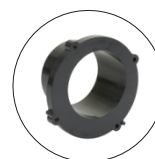
STDR10 SVDR10 SXDR10 SZDR20