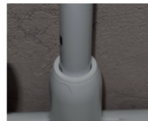
avec bague de réduction