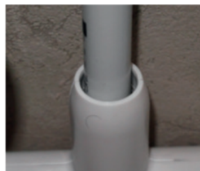
sans bague de réduction

La bague de réduction permet de masquer de façon esthétique l'écart de diamètre entre un tube FLUXO® Ø 16 et un cache-raccord Ø 20. Elle répond à cette problématique dans les cas d'une utilisation de pièces inégales (diamètres différents). Pour plus d'informations, consulter la documentation NOTCACHFL20B.